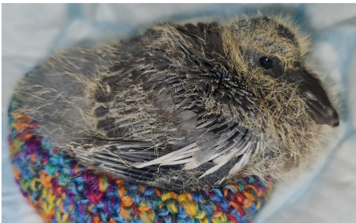
Ringeltaubenküken ca. 3 Wochen