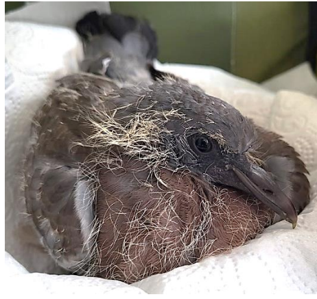
Ringeltaubenjungtier ca. 4 und 5 Wochen jung