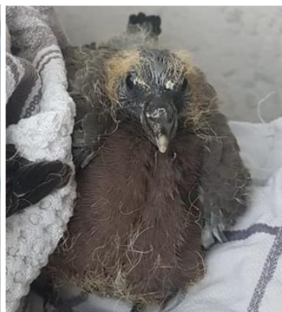
Ringeltaubenjungtier ca. 4 Wochen