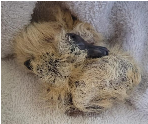
bedunte Küken 1 Tag jung