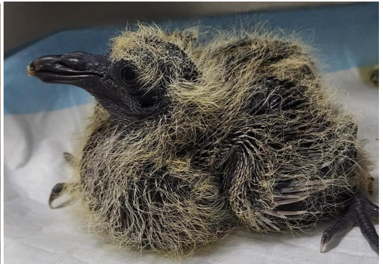
Ringeltaubenküken ca. 2 Wochen jung erste Federkiele