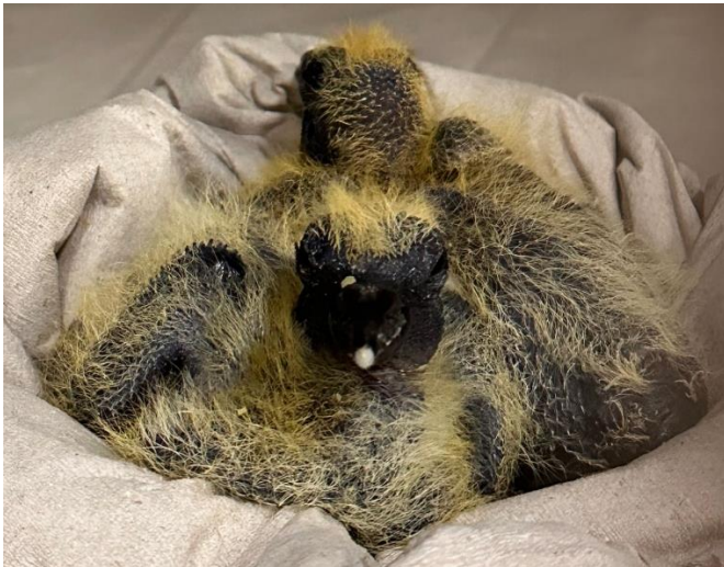
Ringeltaubenküken wenige Tage jung